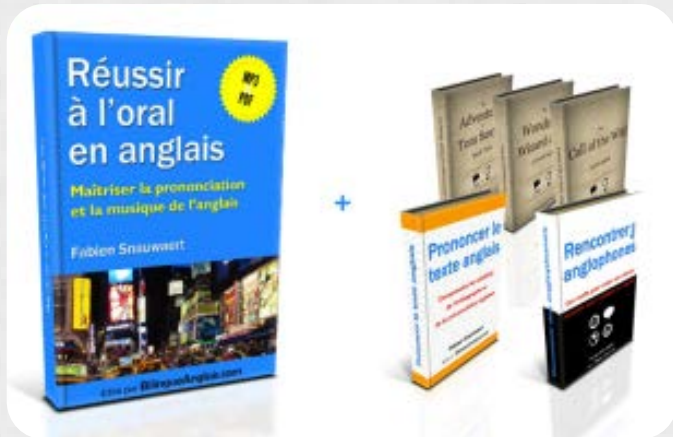
Le pack Réussir à l'oral en anglais